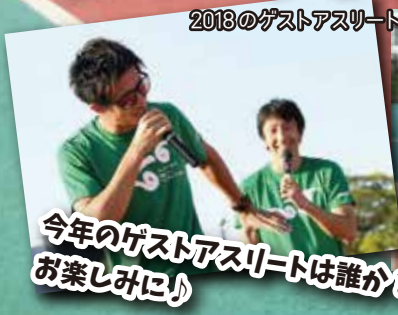
2018のゲストアスリート

4人揃えば誰でも参加OK! リレーのいろはを知るリレークリニックや、 トップアスリートとの夢のリレー対決など リレーを存分に楽しむイベントを開催! スポーツの秋は、みんなでリレーを楽しもう。